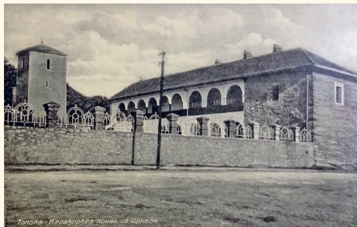
Топола - Карађорђевог Монаха са Црквом

Доласком на српски престо Карађорђевог унука краља Петра Првог Великог Ослободиоца 1903. године, Топола бележи нови период процвата. Већ наредне године варошица је одвојена од села, чиме је постала самостална општина и трговачко-занатско насеље. Будући да је краљ своју отаџбину напустио као дете и у изгнанству